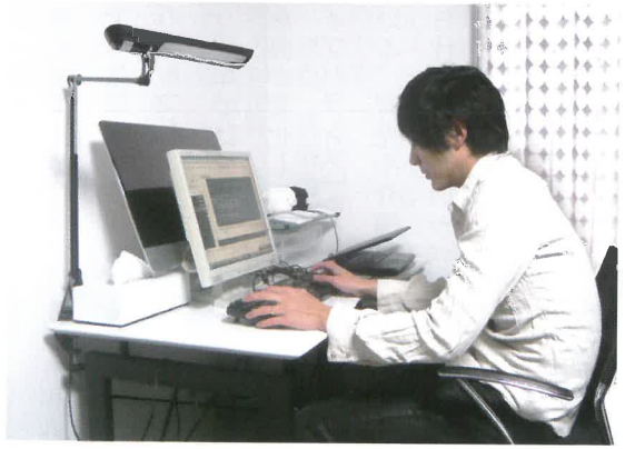
イクメン社員のワークライフバランスのテスト実施

く男性社員にも関心をもってもらえ ると思っただけです。社内とどのよ うにコミュニケーションをとるか、 社員のモチベーションの維持、労働 時間の管理、業績評価、情報セキュ リティ対策などの課題はありまし たが、総務省のテレワーク導入モデル での実施を最優先にして、実施しな がら課題を解決していきました。体 験者の2人は、育児など家事を手伝 うことで、家族とのコミュニケーション が増え、時間的余裕が生まれたそ うです。ただ、慣れていないので、 自宅の中で家事と仕事の気持ちの切 り替えに苦労したと語っていました」 働きやすい職場環境をつくりたい